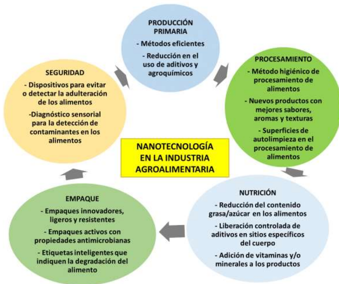
Figura. Empleo de la nanotecnología en la industria alimentaria (Lira et al. , 2018).

de plagas en cultivos, es importante hacer estudios científicos para tener un enfoque racional y facilitar el desarrollo de nanoproductos comerciales en esta área del conocimiento (Lira et al. , 2018)